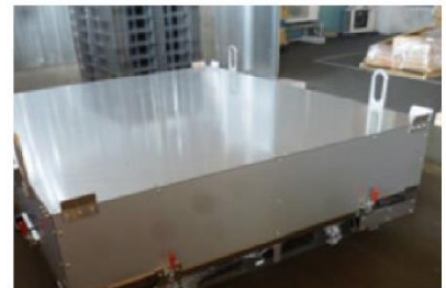
大型光罩玻璃基板搬运专用箱 (ALPOLIC铝复合板等)