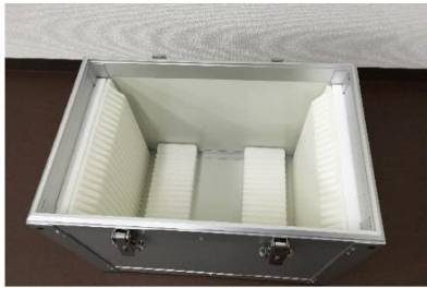
FPD用玻璃基板搬运专用箱 (ALPOLIC铝复合板等材料)