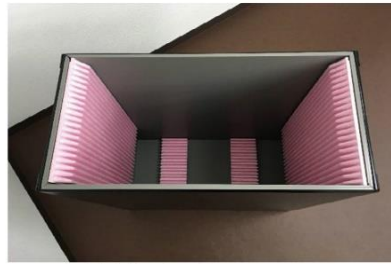
FPD用玻璃基板搬运专用箱 (塑料材质)