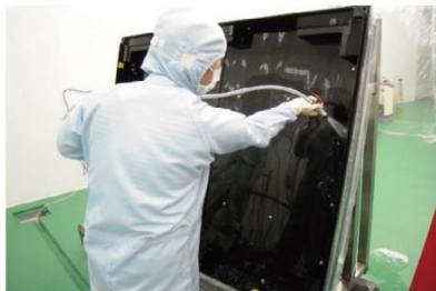
光罩板搬运专用箱清洗 (洁净室)