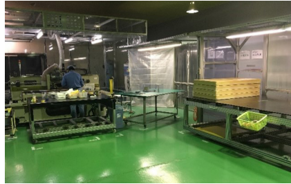
定制业务 表面加工设备