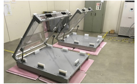
大型光罩玻璃基板搬运专用箱 (塑料材质)