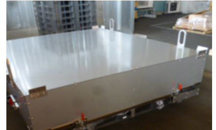
大型光罩玻璃基板搬运专用箱 (ALPOLIC 铝复合板等)