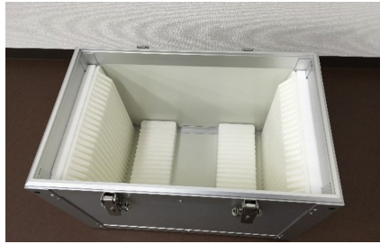
FPD用玻璃基板搬运专用箱 (ALPOLIC 铝复合板等材质)

1924 年创立，作为最佳合作伙伴，长期在玻璃加工及周边领域业务上提供最佳服务。 从事高精度高质量玻璃搬运专用箱的制造、洁净室清洁以及物流支持服务等多方面业务。