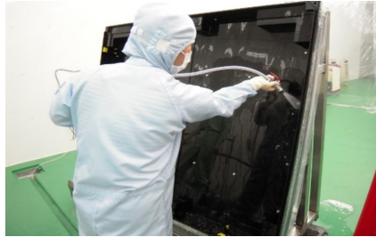
光罩板搬运专用箱清洗 (洁净室)